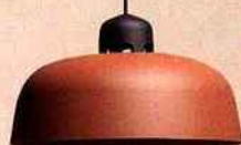
W162 DALSTON de Sam Hecht & Kim Colin Suspension lumineuse en aluminium laqué WÄSTBERG