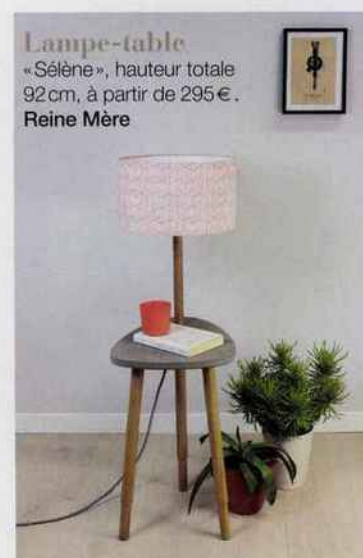
Lampe-table « Sélène », hauteur totale 92 cm, à partir de 295 €. Reine Mère