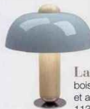
Lampe « Clochette », bois clair, socle chromé et abat-jour en acier, 113 €. Kos Lighting