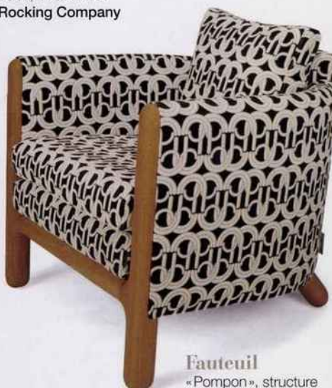
Fauteuil « Pompon », structure en chêne naturel, 2.100 €. Désio