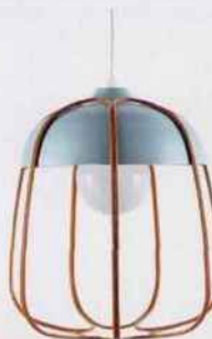
Suspension « Tull » en métal Turquoise/Orange, Ø36,5 cm, 374 €. Incipit sur LightOnline