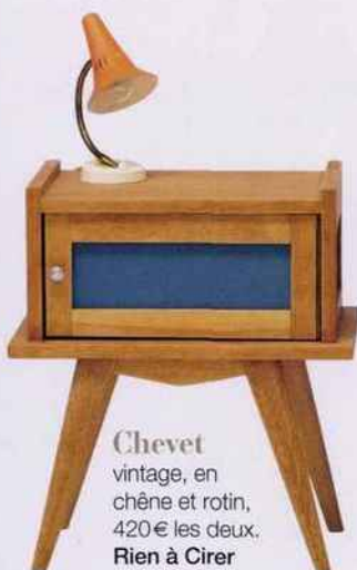
Chevet vintage, en chêne et rotin, 420 € les deux. Rien à Cirer