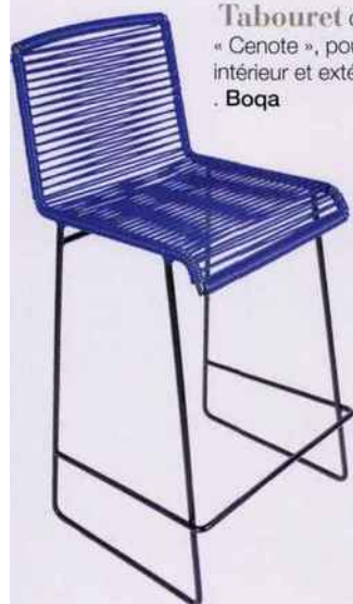
Tabouret de bar « Cenote », pour usage intérieur et extérieur, 229 €. Boqa