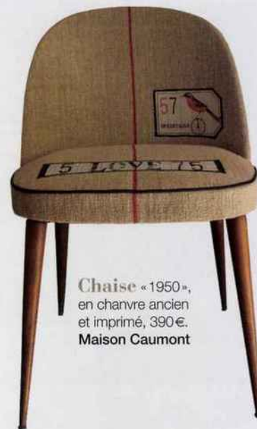
Chaise « 1950 », en chanvre ancien et imprimé, 390 €. Maison Caumont